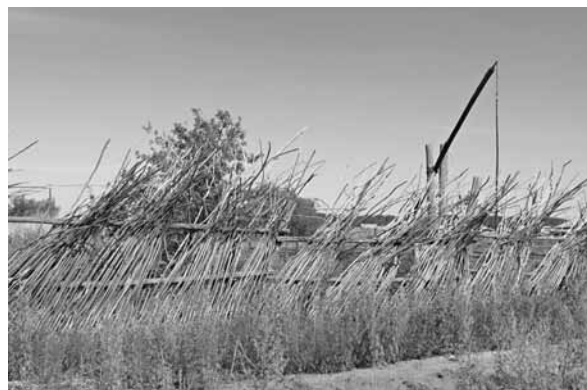
Рис. 13. Плетень. Село Усть-Кормиха Волчихинского р-на, 2011 г.