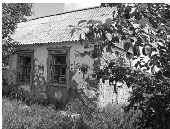
Рис. 2. Саманный дом. Село Николаевка, Поспелихинский р-н, 2008 г.

хайловский, Кулундинский, Славгородский, Родинский, Бурлинский, Табунский, Ключевской и другие районы. Границу ядра составляют районы, протянувшиеся с севера на юг вдоль трассы Барнаул – Павловск – Мамонтово – Романово – Волчиха – Михайловка до Углов. Эти райцентры и сами районы являются периферией полиэтнического степного запада, где сохранились и полиэтнические и моноэтнические села, и память потомков переселенцев о своих корнях. Внутри этого ядра и его пограничья есть ареалы локального расселения украинцев, немцев, казахов, татар и смешанные поселения. Например, немецкие села преобладают на территории Славгородского и Кулундинского районов (совр. Немецкий национальный район) при наличии локального расселения немцев в других районах. Этническим ядром расселения украинцев является Родинский район, а также Романовский; казахов – Михайловский, Бурлинский районы, при наличии казахских поселений в Кулундинском районе (с. Кирей), Панкрушихинском районе (с. Кзыл-Ту); Угловский район (с. Бор-Кособулат, с. Павловка) и др. При этом в районах расселения казахов существуют и татарские (Беленькое Угловского района) и казахско-татарские села (с. Кирей Кулундинского района). Завершают переселенческую историко-этнографическую зону районы, расположенные вдоль Змеиногорского тракта Барнаул – Алейск –