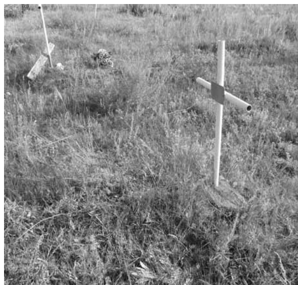
Рис. Кладбище исчезнувшего села Осиновка (Волчихинский р-н): захоронение русских (на переднем плане) и немцев (на заднем плане). 2011 г.

компромиссы в духовной сфере. В русско-казахских селах с немусульманскими народами граница взаимопроникновения отодвинута и менее проницаема. Проявляется это прежде всего в обрядах жизненного цикла, например в похоронном обряде, и существовании отдельных кладбищ у казахов-мусульман и христианских народов. Так, по материалам Волчихинской экспедиции 2011 г. зафиксированы отдельные кладбища казахов в Усть-Волчихе (проживало менее 10 человек), в с. Бор-Форпост (проживало около 20 человек), хотя численность казахов в этих селах невелика, тогда как у немцев, украинцев и русских этого района существовали совместные погосты. Примером является кладбище исчезнувшего села Осиновки Волчихинского района. Сохранившиеся надмогильные памятники показывают, что русские захоронения с