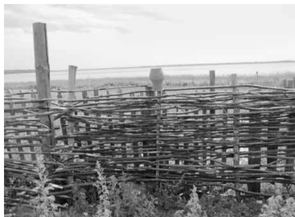
Рис. 14. Фрагмент плетня. Село Усть-Кормиха Волчихинского р-на, 2011 г.

Следы строительных традиций с использованием