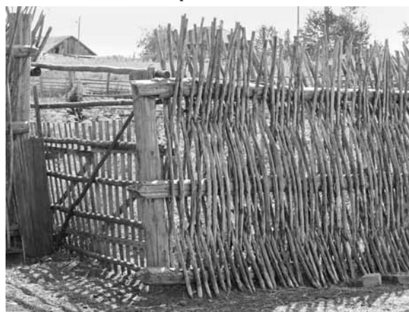
Рис. 15. Фрагмент плетня. Село Усть-Кормиха Волчихинского р-на, 2011 г.

глины, камыша, соломы, но уже украинцев видны в соседних селах Рубцовского района. Только в годы советской власти украинцы Алтая перешли на строительство деревянных домов, строя изначально привычные хаты-мазанки, крытые соломой. В современном Веселоярске встречаются такие мазанки, которые используются в качестве летних кухонь, сараев. Особый украинский колорит придает усадьбам переселенцев плетень. Он до сих пор используется для изгороди в районах традиционного расселения украинцев.