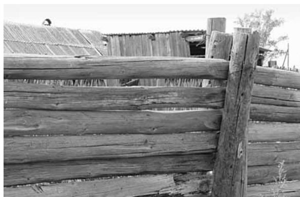
Рис. 12. Фрагмент забора из бревен с креплением «в столб». Село Усть-Кормиха, Волчихинский р-н.