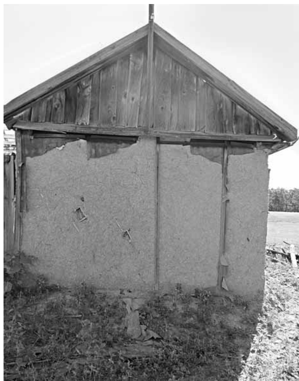
Рис. 16. Оштукатуренный дом из камышовых плит. Село Бор-Форпост Волчихинского р-на, 2011 г.