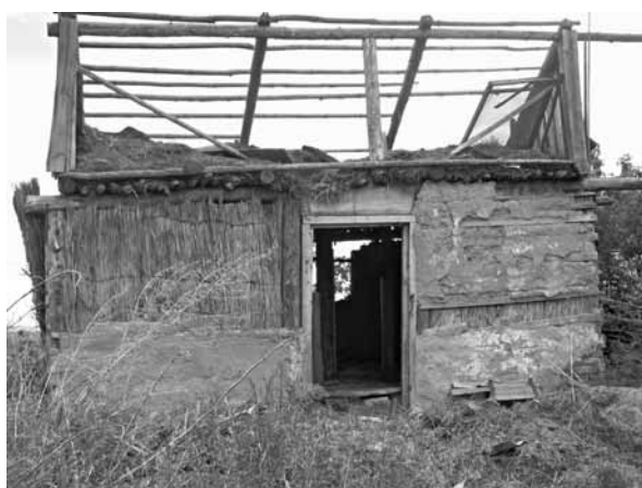
Рис. 9. Зброшенный камышитовый дом. Село Мормыши, Романовский р-н, 2010 г.