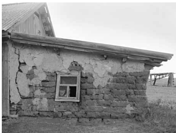
Рис. 5. Пристроенные саманные сени. Село Красноярка, Поспелихинский р-н, 2008 г.

Поспелиха – Рубцовск (сюда же относятся Новичихинский и Егорьевский районы) с дисперсным украинским, немецким и казахским населением. На их территории более заметна русификация этнических переселенцев (например, оставшаяся в основном в документах «украинистость» ряда русско-украинских сел, среди них Ново-Кормиха Волчихинского района, Николаевка Поспелихинского района и др.), но в информационной среде населенных пунктов со-