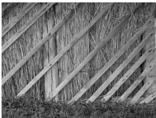
Рис. 10. Фрагмент стены под окнами камышитового дома с отпавшей штукатуркой. Видны щиты из камыша в обшивке. Село Мормыши, Романовский р-н, 2010 г.

тупали место украинцам или немцам или тем и другим вместе взятым. Так, немцы в Славгороде составляли 59,8% от общей численности населения, в Табунском районе — 48,6%, в Хабаровском — 28,4%, в Благовещенском — 17,6%, в Кулундинском — 15,1%, в Бурлинском — 12,7%. Украинцы в Родинском районе составляли 27,6%, в Бурлинском — 23,4%, в Табунском —