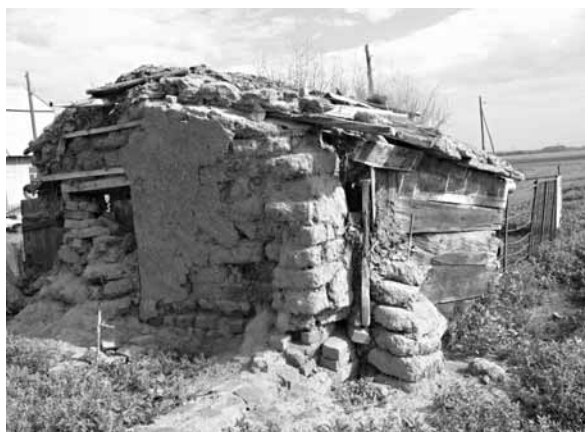
Рис. 3. Смешанный материал с использованием самана, кирпича, досок. Пос. Вавилонский Поспелихинского р-на, 2008 г.

хайловский, Кулундинский, Славгородский, Родинский, Бурлинский, Табунский, Ключевской и другие районы. Границу ядра составляют районы, протянувшиеся с севера на юг вдоль трассы Барнаул – Павловск – Мамонтово – Романово – Волчиха – Михайловка до Углов. Эти райцентры и сами районы являются периферией полиэтнического степного запада, где сохранились и полиэтнические и моноэтнические села, и память потомков переселенцев о своих корнях. Внутри этого ядра и его пограничья есть ареалы локального расселения украинцев, немцев, казахов, татар и смешанные поселения. Например, немецкие села преобладают на территории Славгородского и Кулундинского районов (совр. Немецкий национальный район) при наличии локального расселения немцев в других районах. Этническим ядром расселения украинцев является Родинский район, а также Романовский; казахов – Михайловский, Бурлинский районы, при наличии казахских поселений в Кулундинском районе (с. Кирей), Панкрушихинском районе (с. Кзыл-Ту); Угловский район (с. Бор-Кособулат, с. Павловка) и др. При этом в районах расселения казахов существуют и татарские (Беленькое Угловского района) и казахско-татарские села (с. Кирей Кулундинского района). Завершают переселенческую историко-этнографическую зону районы, расположенные вдоль Змеиногорского тракта Барнаул – Алейск –