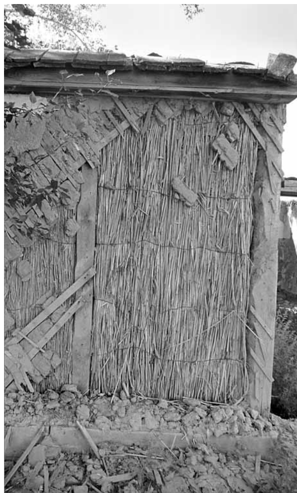
Рис. 18. Фрагмент пристройки камышитового оштукатуренного дома. Село Бор-Форпост, 2011 г.

При этом можно говорить об установке определен-