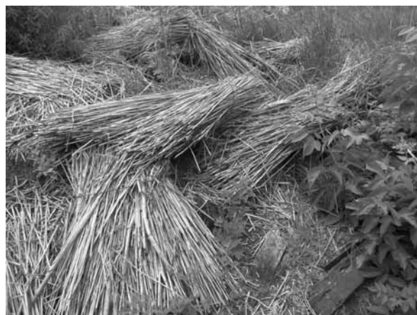
Рис. 11. Пучки камыша разобранного скотного помещения. Село Гуселетово, Романовский р-н, 2011 г.

тупали место украинцам или немцам или тем и другим вместе взятым. Так, немцы в Славгороде составляли 59,8% от общей численности населения, в Табунском районе — 48,6%, в Хабаровском — 28,4%, в Благовещенском — 17,6%, в Кулундинском — 15,1%, в Бурлинском — 12,7%. Украинцы в Родинском районе составляли 27,6%, в Бурлинском — 23,4%, в Табунском —