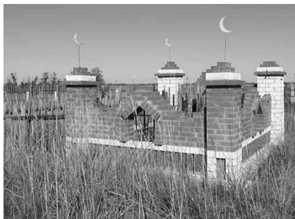
Рис. Казахское кладбище в с. Усть-Волчиха