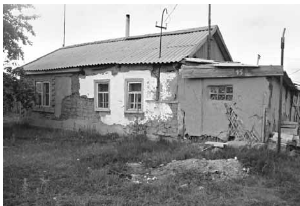
Рис. 1. Саманный жилой дом. Село Красноярка, Поспелихинский р-н, 2008 г.