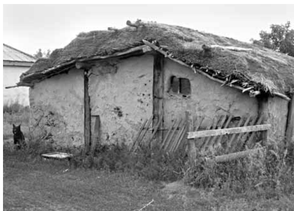
Рис. 4. Теплый хлев с использованием самана под соломенной крышей. Село Красноярка, Поспелихинский р-н, 2008 г.