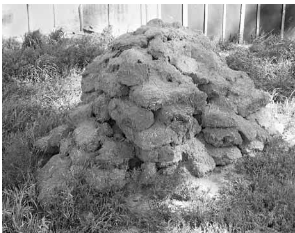
Рис. 7. Куча самана из разобранного дома. Пос. Николаевка Поспелихинского р-на, 2008 г.

храняются украинские, компоненты этнических культур.