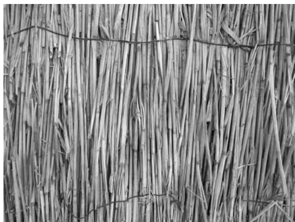
Рис. 17. Строительный щит из камыша. Село Бор-Форпост Волчихинского р-на, 2011 г.

Но остались и этнические традиции – например, «вечерины» в украинской традиции и «девичник» в русской традиции. В русском свадебном ритуале в старожильческих селах «девичник» отличался печальным контекстом: невеста прощалась со своей беззаботной жизнью, со своими родителями и подругами. Пели грустные песни и оплакивали прежнее время, обряд был насыщен причитаниями и плачами невесты. А вот «вечерины» у украинцев в украинских или смешанных русско-украинских селах проходили иначе, с шутками, прибаутками, с веселыми песнями. Невеста надевала лучший наряд, украшала голову венком с разноцветными атласными лентами, приглашала подружек, и они с песнями гуляли по селу.