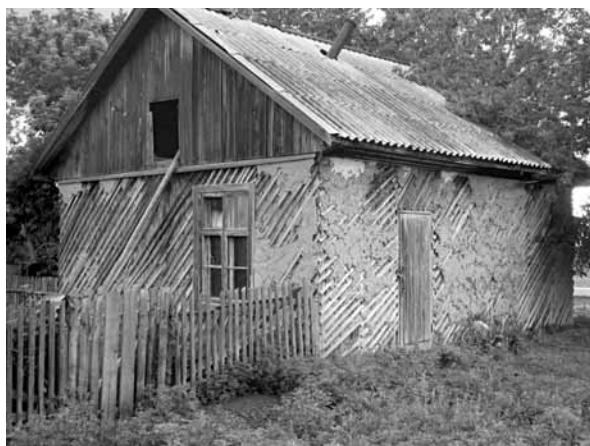
Рис. 8. Камышитовый дом. Село Мормыши, Романовский р-н, 2010 г.