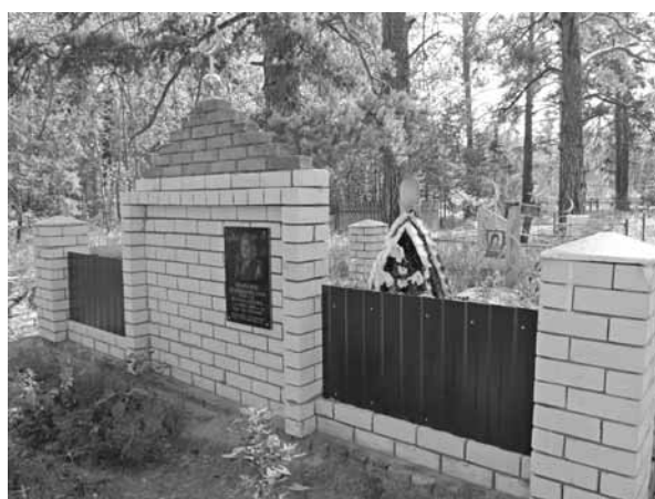
Рис. Казахское кладбище в с. Бор-Форпост

компромиссы в духовной сфере. В русско-казахских селах с немусульманскими народами граница взаимопроникновения отодвинута и менее проницаема. Проявляется это прежде всего в обрядах жизненного цикла, например в похоронном обряде, и существовании отдельных кладбищ у казахов-мусульман и христианских народов. Так, по материалам Волчихинской экспедиции 2011 г. зафиксированы отдельные кладбища казахов в Усть-Волчихе (проживало менее 10 человек), в с. Бор-Форпост (проживало около 20 человек), хотя численность казахов в этих селах невелика, тогда как у немцев, украинцев и русских этого района существовали совместные погосты. Примером является кладбище исчезнувшего села Осиновки Волчихинского района. Сохранившиеся надмогильные памятники показывают, что русские захоронения с